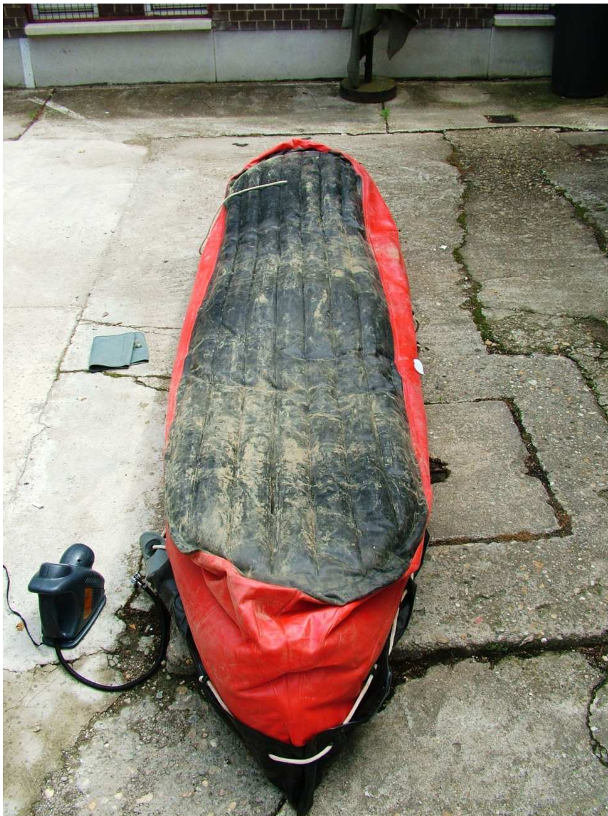
3.ábra A gumikajak felfordított pozícióban