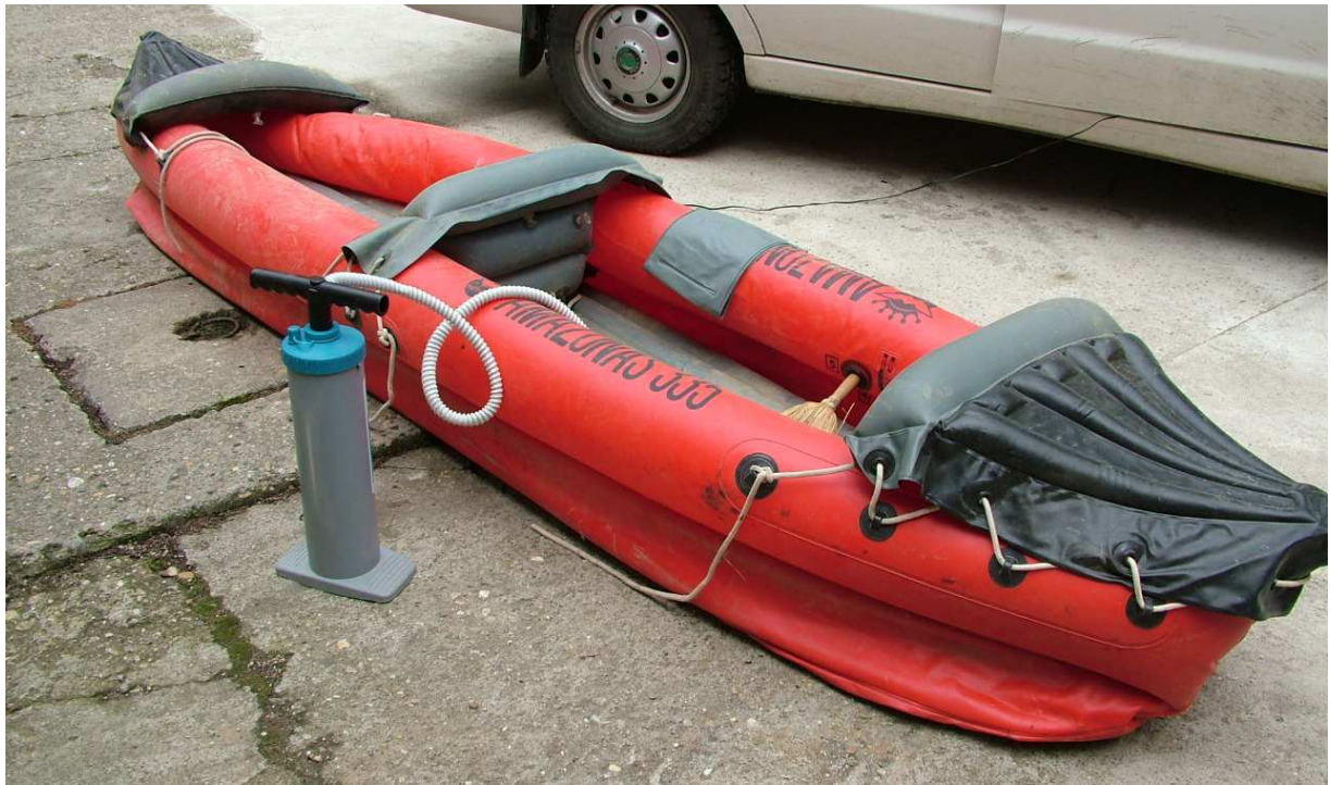
1. ábra A felfújható gumikajak