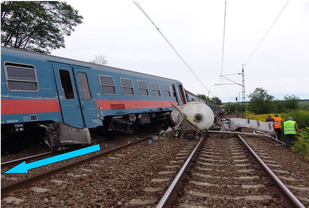
8. ábra) A bal vágányon kisiklott szerelvény és a jobb vágányt elzáró betonkeverő