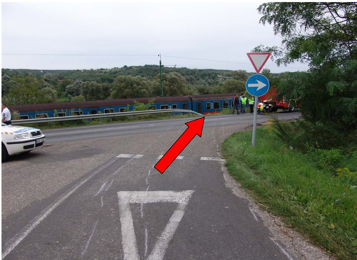
3. ábra) Gépjármű haladási iránya a nagytarcsai útélágazásnál