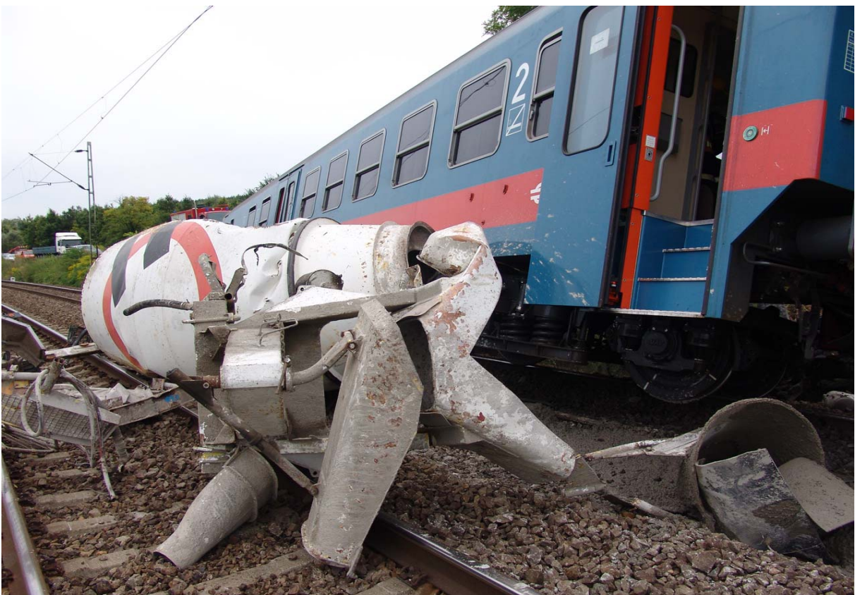
9. ábra) A jobb vágányt elzáró betonkeverő roncsai