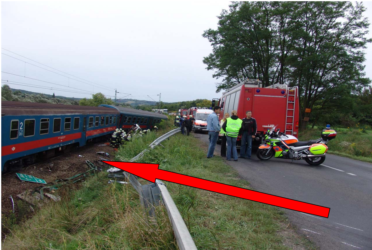
4. ábra) A vasúti pályára esés iránya