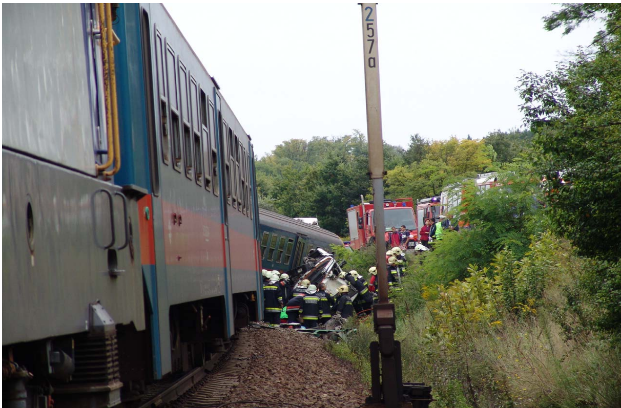
7. ábra) A bal vágányon kisiklott szerelvény