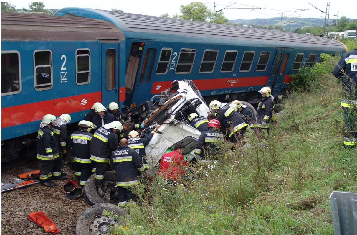
5. ábra) A totálkáros gépjármű