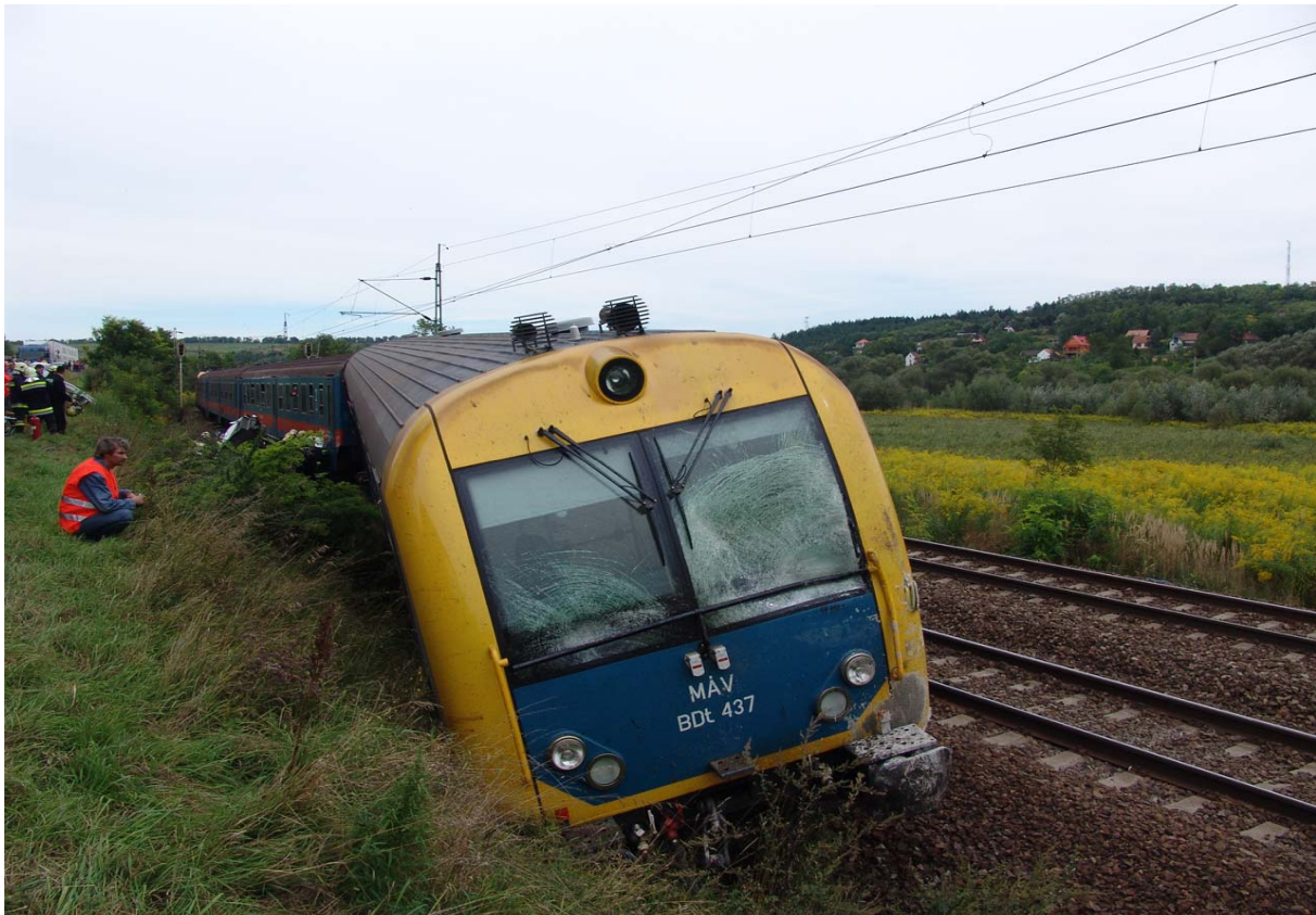
6. ábra) A kisiklott vezérlőkocsi