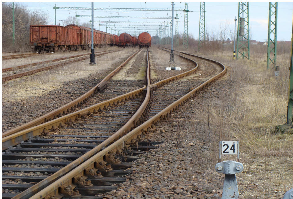
3. ábra: Az eset helyszínének áttekintő képe

Az állomás adatainak további részletezése nem szükséges.