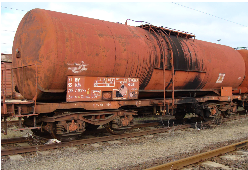
4. ábra: Az esetben részes kocsi

A váratlan vasúti esemény során vasúti járműben sérülés nem történt.