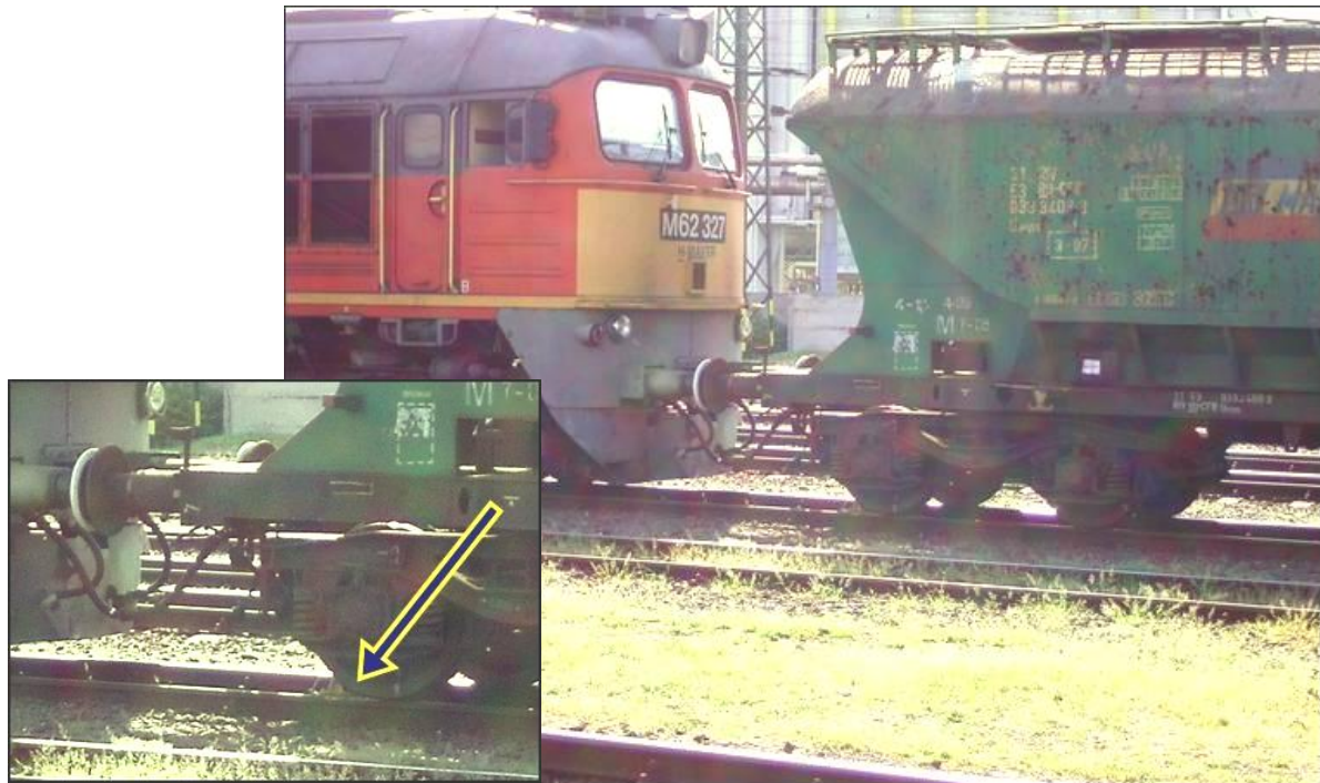
8. ábra: A „vasútbarátok” által készített fotó a kihaladó vonatról

Az eset vizsgálata során a Vb birtokába került egy fénykép, melyet az eset idején Debrecen állomáson vonatokat fényképező „vasútbarátok” készítettek, melyen látható a kihaladó tehervonat első kocsija alatt maradt féksaru.