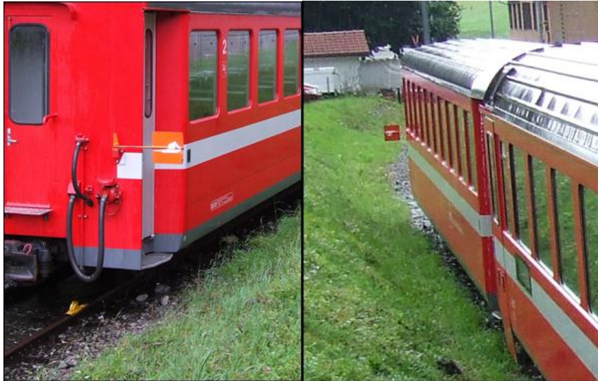
9. ábra: Figyelmeztető jel

A külföldi gyakorlatban jellemzően két módja ismeretes a járművek alatt alkalmazott rögzítő eszközök megjelölésére. Az egyik az, amikor a „hagyományos” sarura a vasúti jármű alkalmas helyén rögzített figyelmeztető jellel hívják fel a figyelmet.