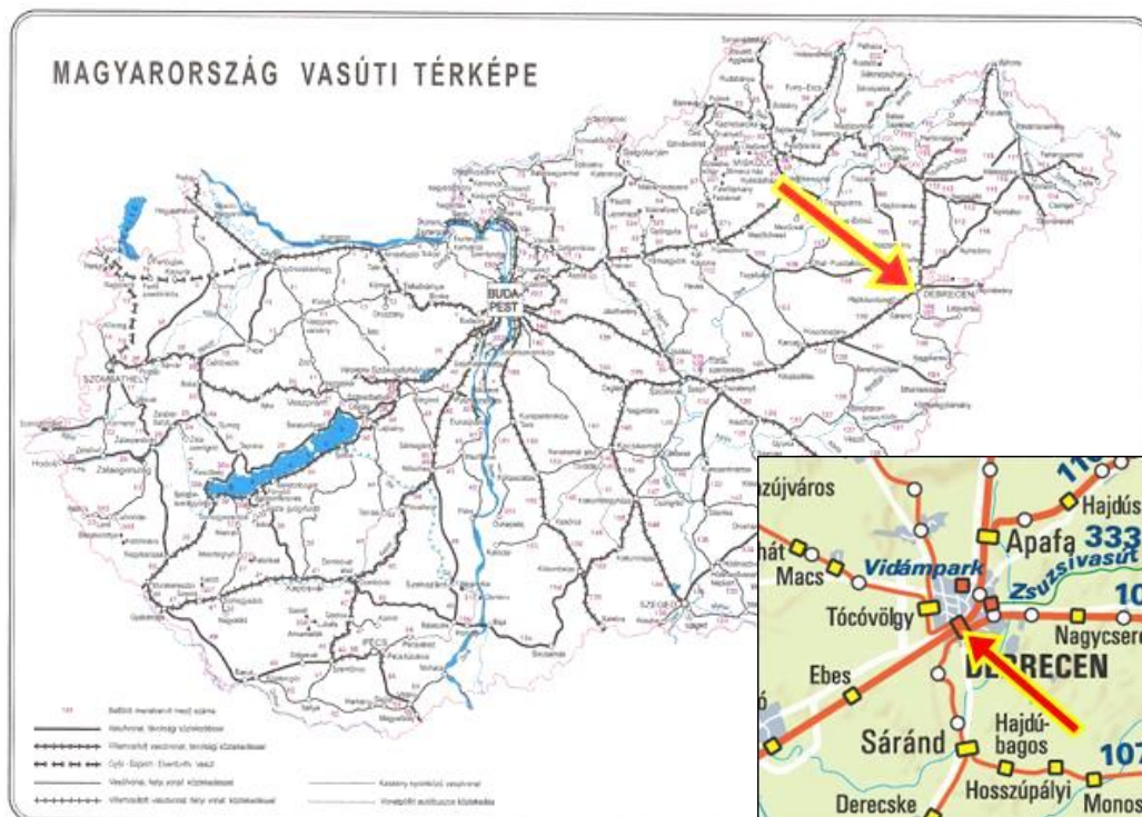
1. ábra: Az eset helye

Debrecen állomás, XIV sz. vágány, 2220+97 sz. szelvény (1, 2. ábra)