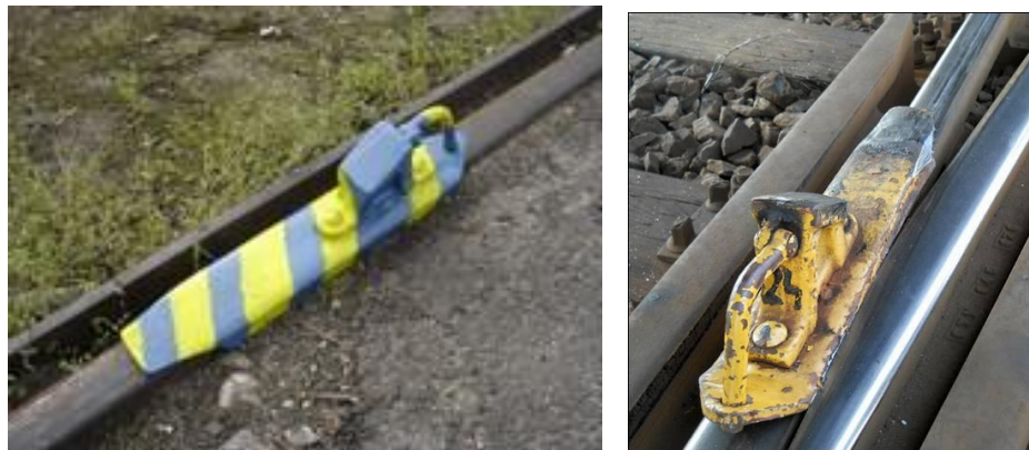
9. ábra: Friss festésű rögzítősaru és a helyszínen talált kopott saru

A Vb az eset vizsgálata során szükségesnek tartja megjegyezni, hogy a magyar vasúti hálózaton alkalmazott rögzítő és féksaruk észlelhetősége sok esetben kívánni valót hagy maga után. A Vb gyakorlati tapasztalata az, hogy a beszerzést követően nem minden esetben követik figyelemmel az eszközök avulását, különös tekintettel a festés kopását. Az eredetileg sárgára festett féksaruk, illetve a sárga-kék festésű rögzítő saruk festésüknél fogva könnyen észlelhetőek, azonban a folyamatos használat során fellépő jármű-saru-sín kölcsönhatás következtében az eredeti festés megsérül, kopik vagy töredezetté válik. (9. ábra)