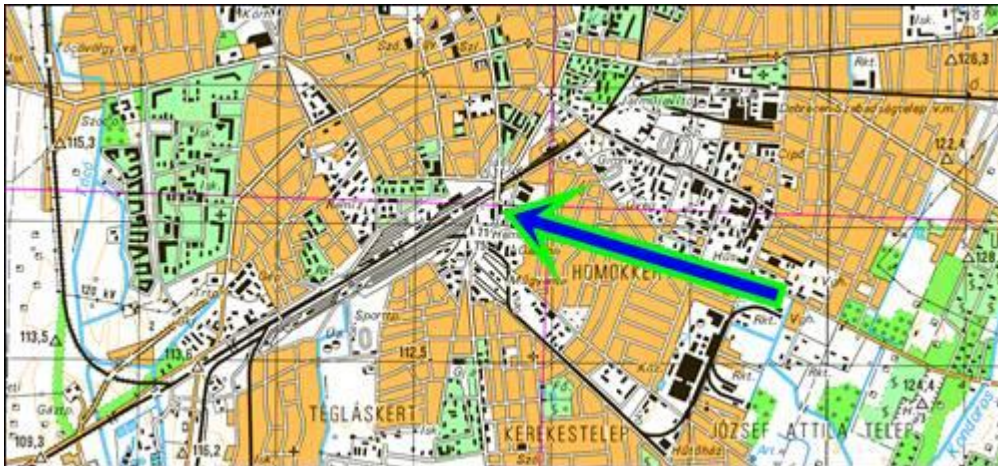
2. ábra: Az eset helye