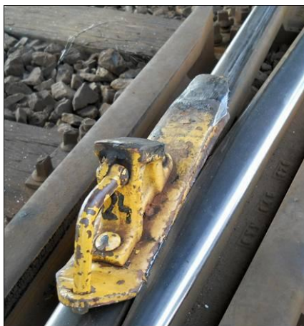
6. ábra: A kitérőben megszorult féksaru

A vontatójármű a XIV. sz. vágányon történt elindulást követően a rögzített adatok kiértékelése szerint 160 méter utat tett meg, mely során a vonat sebessége a 10 km/h-t nem haladta meg. A vonat a siklást követően a 2220+97 sz. szelvényben állt meg.