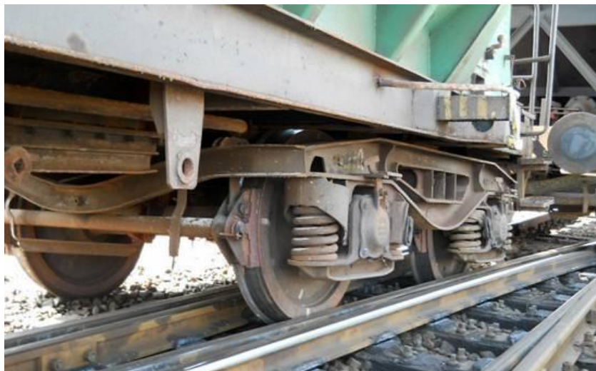
4. ábra: A kisiklott teherkocsi

Az eset következtében a kisiklott 31 53 933 3408-3 és 31 53 933 3933-0 pályaszámú teherkocsik kismértékben sérültek.