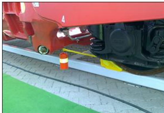
10. ábra: Jobb észrevehetőséget biztosító kivitelben készült eszköz

A másik esetben pedig olyan eszközt alkalmaznak, melynek figyelem felkeltő festése mellett egy kinyíló, színes zászlóval vagy bójával hívja fel magára a személyzet figyelmét.