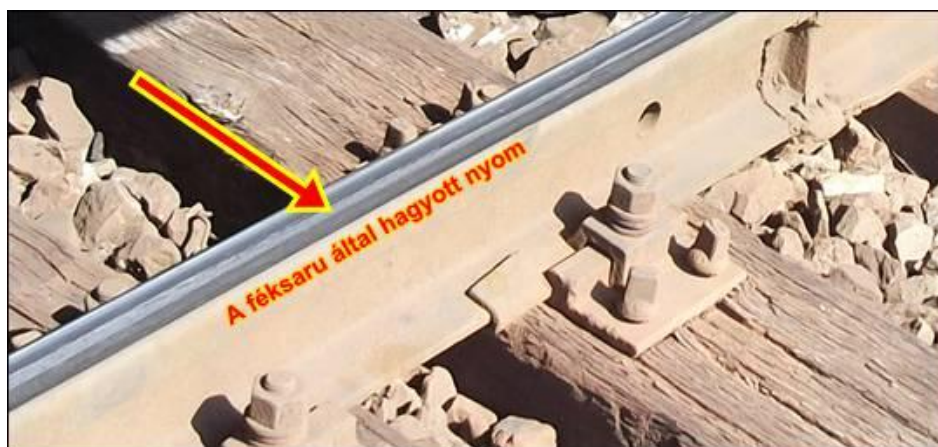
7. ábra: A féksaru által hagyott csúszási nyom a sín futófelületén

A helyszínen rögzített nyomok alapján megállapítható, hogy a féksaru a 2219+17 sz. szelvényben volt elhelyezve a vonat első kocsijának menetirány szerinti első tengelye alatt a bal sínszálon. A kerék alá szorult saru csúszásának nyoma a sínfejen felismerhető volt.