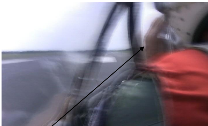
A pilóta keze nem a HVK-n van.

A repülőgép hajtómű indítását és a rendszerek ellenőrzését a parancsnok pilóta feltett szemüvegben végezte, amelyet elmondása szerint korábbi repüléseikor a kigurulás előtt mindig levett, most azonban magán hagyta. Magyarázat nem volt rá. A kabinban elhelyezett kamera felvételén jól látható, hogy a repüléshez alkalmatlan kialakítású szemüveg zavarta a pilótát. A gurulás megkezdésétől többször is igazgatta szemüvegét, ezért érthetetlen a Vb számára, hogy legkésőbb a felszállás megkezdése előtt miért nem vette le.