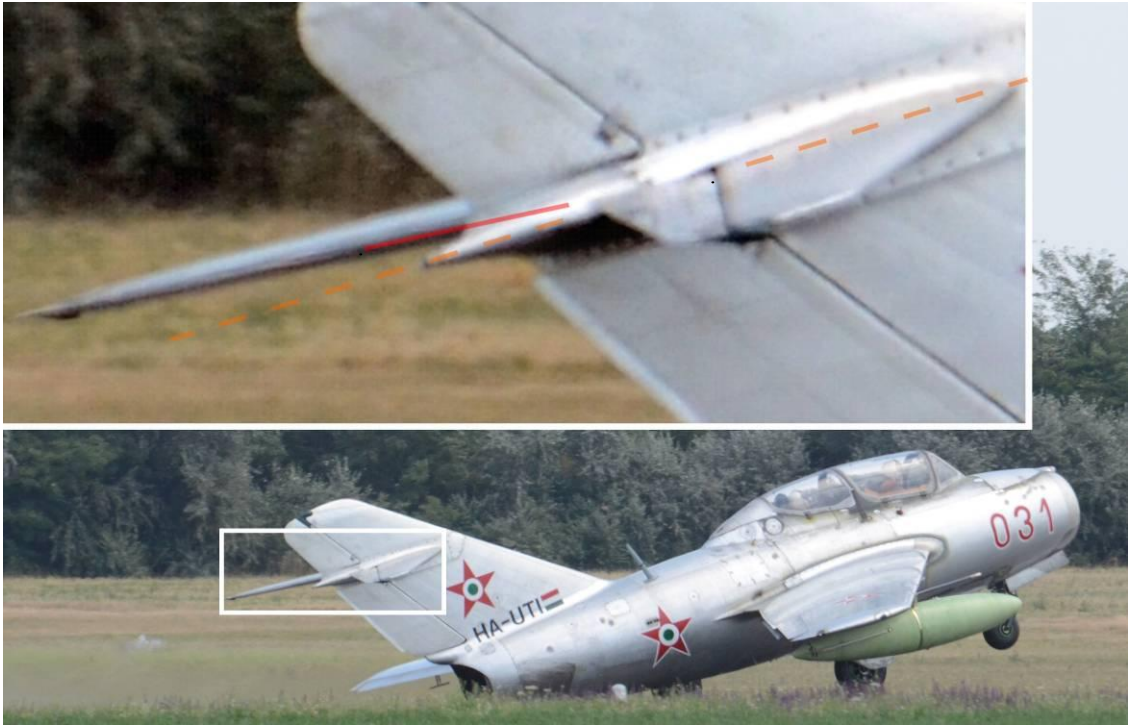
A magassági kormány kitérése, amely az elemelkedésnél az azonnali átesést okozta.

Horizont helyzet a kabinkerethez viszonyítva. Orrfutó a betonon, a repülőgép viszonylagos bólintási szöge 0^{\circ}