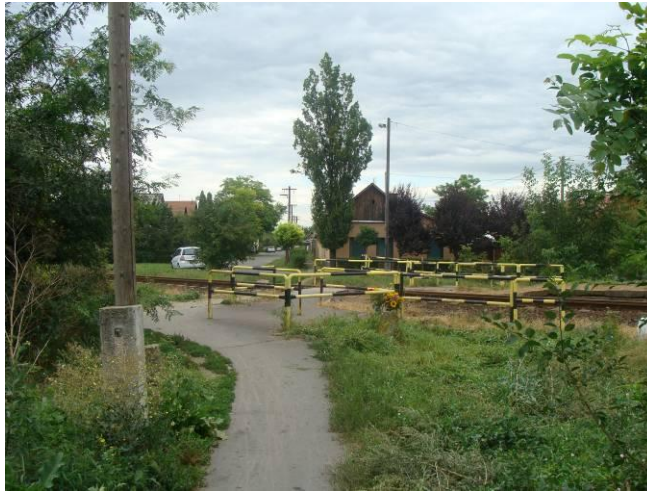
5. ábra A gyalogos átjáróhoz vezető út (Szentes központja felől fényképezve)

A gyalogos átjáró Szentes központja felől egy gépjármű forgalom számára meg nem nyitott utcán közelíthető meg. A gyalogos átjáró előtt mindkét oldalon labirint-korlát található. A rálátás a labirint korlát vonalától mindkét oldal irányából biztosított. Szentes központja felől a labirint-korlát mellett kitaposott ösvény található, mert a kerékpárosok gyakran ott közelítik meg az átjárót.