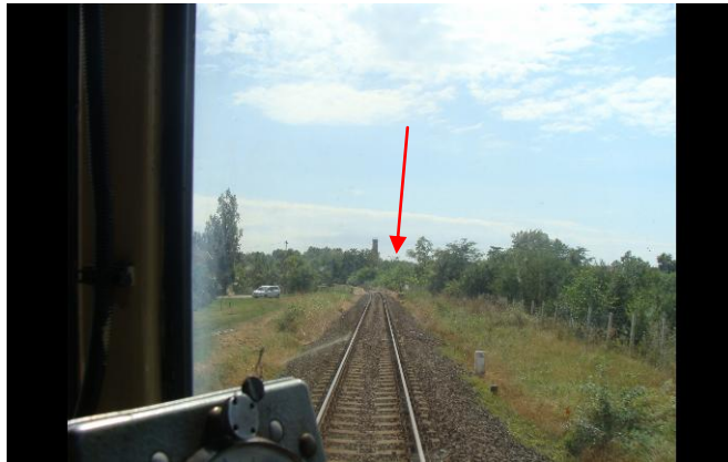
7. ábra Rálátás a gyalogos átjáróra 130 m távolságból

A 24+90 sz. szelvényben lévő gyalogos átjáró előtt kb. 130 m-re a mozdonyvezető egy kerékpárját toló gyermeket látott az átjáróba behaladni.