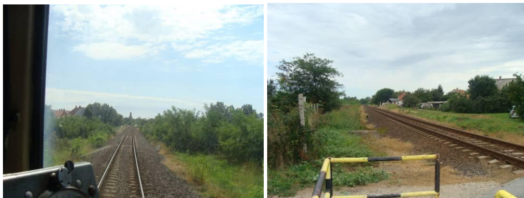
4. ábra Rálátás

Szentes és Szegvár állomások között a vasúti pálya egyvágányú, 48 kg/fm sínszalakkal. A gyalogos átjáró előtt a vasúti pálya vonalvezetése mintegy 300 m hosszan egyenes, előtte egy jobbos ív található.