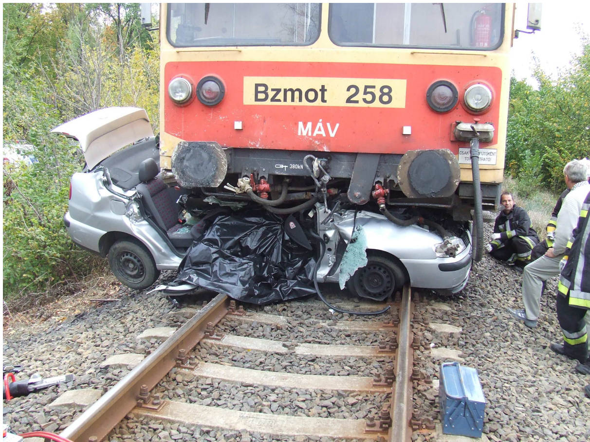
A balesetet szenvedett közúti jármű

A helyszínen lemért megállási távolság 264 méter.